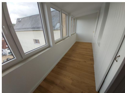
der verglaste Balkon

Unsere Angaben erfolgen gemäß der uns vom Auftraggeber erteilten Auskünfte. Wir haben diese nicht geprüft und machen sie uns nicht zu Eigen. Wir übernehmen keine Haftung für Richtigkeit, Vollständigkeit und Aktualität. Schadenersatzansprüche sind uns gegenüber mit Ausnahme von vorsätzlichem und grob fahrlässigem Verhalten ausgeschlossen.