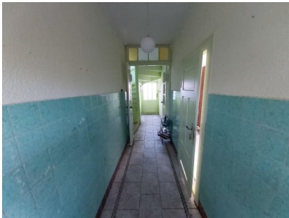
der Flur im Erdgeschoss

Energieausweis: Gewerken. Der Energieausweis ist beantragt.