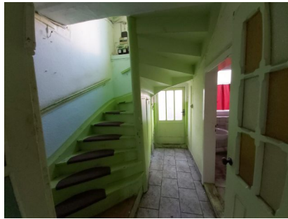
der Flur im Erdgeschoss