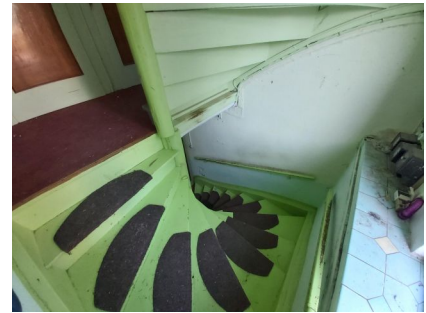
die Treppe zum Obergeschoss