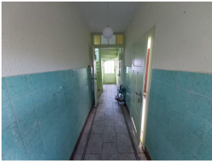
der Flur im Erdgeschoss

Energieausweis: Gewerken. Der Energieausweis ist beantragt.